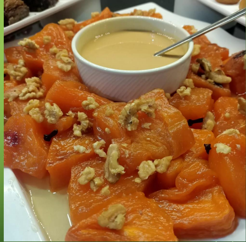
Türkiye'ye Özgü Yöresel Yemekler