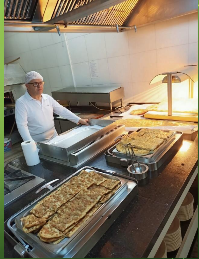
Türkiye'ye Özgü Yöresel Yemekler