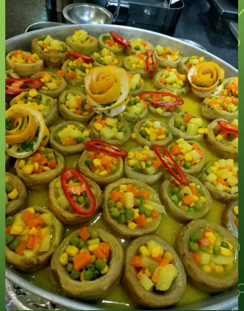
Türkiye'ye Özgü Yöresel Yemekler