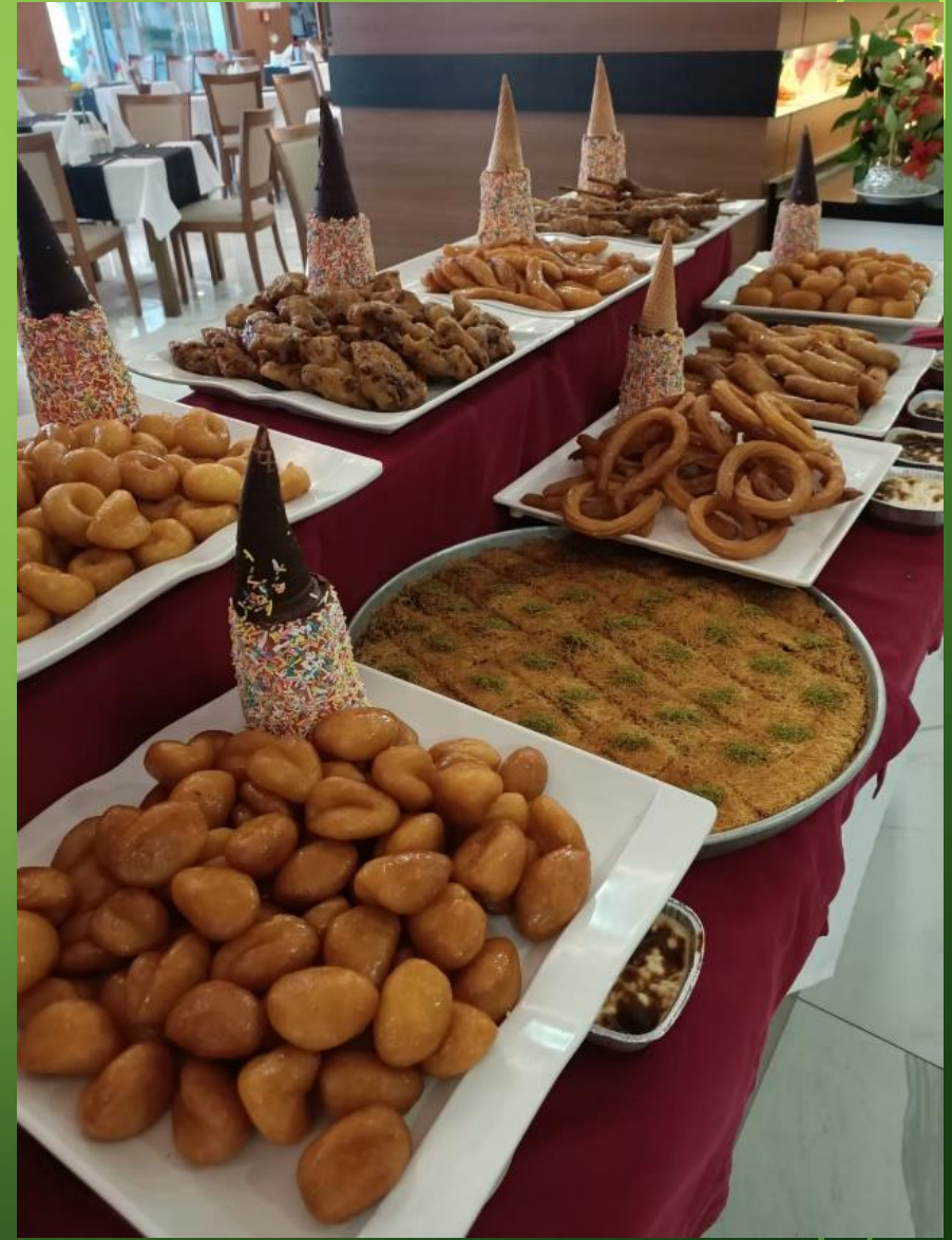
Türkiye'ye Özgü Yöresel Yemekler